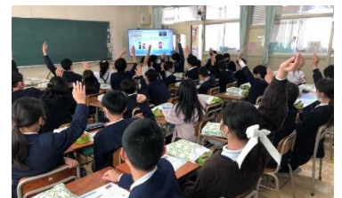
2021年度に実施した オンライン出前授業の様子

今後も、子どもたちの食物アレルギーへの理解・関心がさらに深まり、みんなで一緒に食事をおいしく楽しむために、自分でできることを考えて行動することに繋がる活動を続けてまいります。