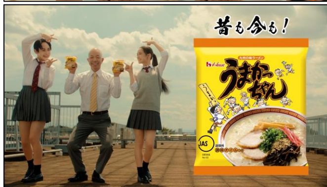
画像：新 TVCM 「昔も今も」篇より

・ブランドサイトにて CM 動画公開中： https://housefoods.jp/products/special/umakachan/index.html