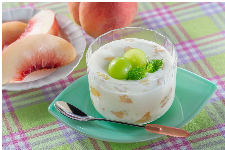
【アレンジレシピ：生クリームフルーチェ】

フルーチェで定番人気の「ミックスピーチ」とは全く異なる新しい味わいをお楽しみいただけます！パッケージの裏面で紹介している生クリームでのアレンジもおすすめです。