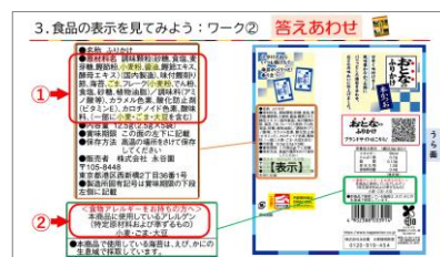
【ワーク:食品表示の見方を学ぼう】