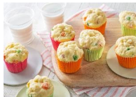
スイートコーン風味のカラフル蒸しパン （「シチューミクス」〈スイートコーン〉使用）