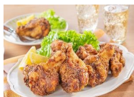
味付け簡単！揚げないフライドチキン （「シチューミクス」〈ビーフ用〉使用）