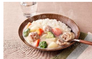
豚こまボールのかけシチュー （「シチューミクス」〈クリーム濃厚仕立て〉使用）