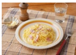
生クリームいらずの濃厚カルボナーラ （「シチューミクス」〈クリーム〉使用）