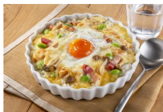
【カルボシチューをリメイク】 カルボドリア