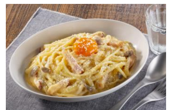
【カルボシチューをリメイク】 スパゲッティカルボナーラ