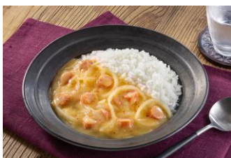
辛い！？カルボシチュー

「カルボシチュー」を活用したアレンジメニューやリメイクレシピなどを順次公開してまいります。