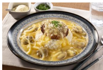
濃厚チーズの ハンバーグカルボシチュー